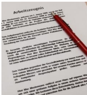
Ein gutes Zeugnis ist einklagbar!