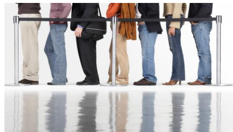
Arbeitsverhältnis zwischen Entleiher und Leiharbeiter?

Seit Einführung des Gebotes der lediglich vorübergehenden Arbeitnehmerüberlassung in das Arbeitnehmerüberlassungsgesetz (AÜG) war in der Rechtsliteratur heftig umstritten, welche Rechtsfolgen eine nicht nur vorübergehende Arbeitnehmerüberlassung nach sich zieht. Insbesondere wurde diskutiert, ob ein Verstoß gegen das Gebot dazu führt, dass in direkter oder analoger Anwendung von § 10 Abs. 1 Satz 1 AÜG kraft Gesetzes ein Arbeitsverhältnis zwischen dem Leiharbeiter und dem Entleiherunternehmen zustande komme.