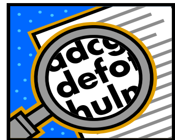
Vertrag, so wichtig wie die Arbeit selbst!

Am 13.06.2014 sind die Neuregelungen zur Umsetzung der europäischen Verbraucherrechtlicherichtlinie (§§ 312 ff. BGB n.F.) in Kraft getreten, die für Verträge zwischen Unternehmern und Verbrauchern über entgeltliche Leistungen u.a. umfangreiche Informationspflichten regeln. Das neue Verbraucherrecht ist grundsätzlich auch auf Bauleistungen anzuwenden mit eingeschränkten Informationspflichten für Verträge über den Bau von neuen Gebäuden oder erhebliche Umbaumaßnahmen an bestehenden Gebäuden. Gerade bei Verträgen über die Instandsetzung und Renovierung von Gebäuden finden die Informationspflichten und ein Widerrufsrecht des Verbrauchers für außerhalb von Geschäftsräumen geschlossener Verträge aber umfassend Anwendung.